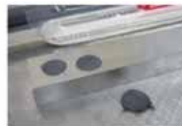
固體潤滑劑埋入後的凸出面 以刀片切斷之